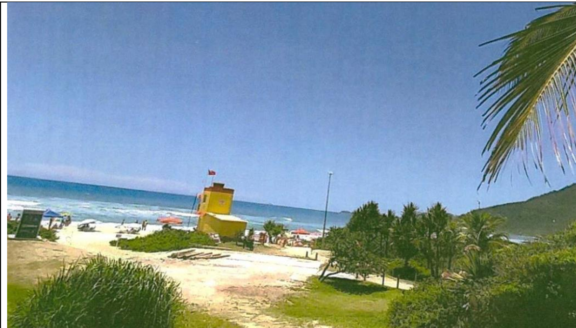
Vista Geral - Situação Atual