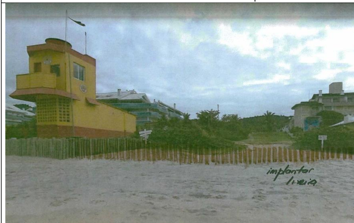
Proposta Recuperação isolamento área de restinga