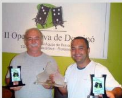
Dupla Campeã segura o Troféu Praia Brava

A dupla campeã, além do troféu da competição, recebeu também, o Troféu Associação Praia Brava, das mãos do atual presidente da entidade, Honorato Tomelin, que será de forma rotativa, ou seja, a posse definitiva do troféu será daquela dupla que for campeã do campeonato por 3 vezes, seguidas ou alternadas.