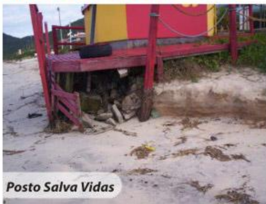
Posto Salva Vidas