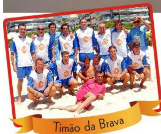
Timão da Brava

Temporada longa esta de 2011. Terça de Carnaval em 8 de março, por certo teremos afluxo de visitantes por longos períodos, fato que exigirá atenção à infraestrutura do nosso balneário, com a quarta feira de cinzas em 9 de março. A atuação da APBRAVA neste veraneio vai ser intensificada na área militar, com vistas a maior SEGURANÇA. Decisão recente do nosso Conselho Diretor permitiu assumir as contas de água às custas de nossa Entidade, melhorando as condições de uso do Posto Policial, que vinha sofrendo constantes interrupções de abastecimento. A partir da base policial, apoio militar à orla marítima, controle da presença de animais e fiscalização de estacionamentos, além da ação policial propriamente dita, são algumas atividades a serem ampliadas nesta temporada de verão.