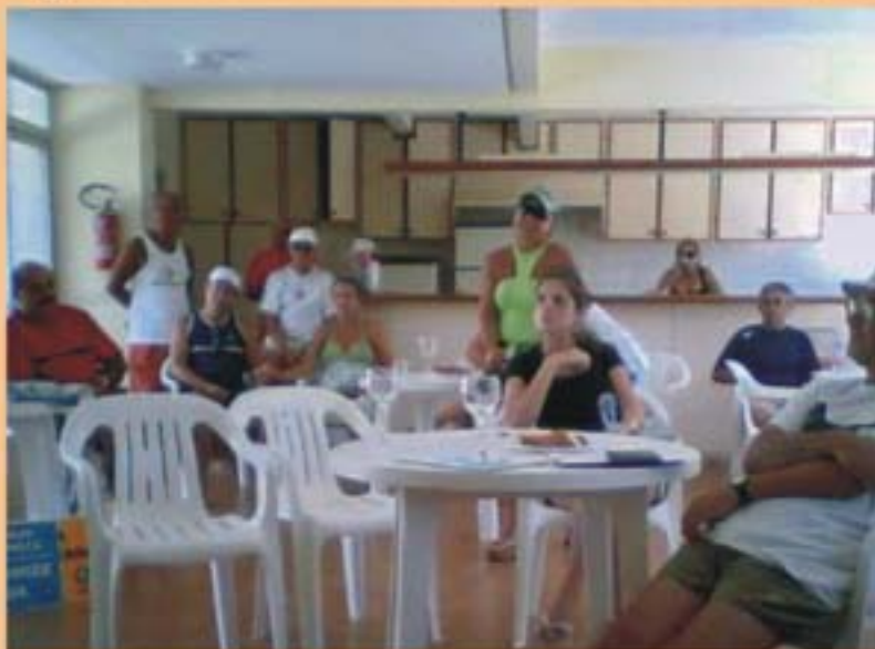
APBRAVA em Assembléia Geral de fevereiro

A Assembléia Geral de fevereiro de 2007, cumprindo Estatuto, decidiu manter a Tabela de Contribuição de Anuidades de Associados, nos mesmos valores do exercício de 2006. O Plano de Ação, constante de diversas medidas já publicadas na edição nº 10 do Jornal da Brava, foi aprovado por unanimidade. O evento, realizado no Condomínio Três Américas, ocupou as dependências do Salão de Festas, por cortesia dos condôminos. A APBRAVA agradece.