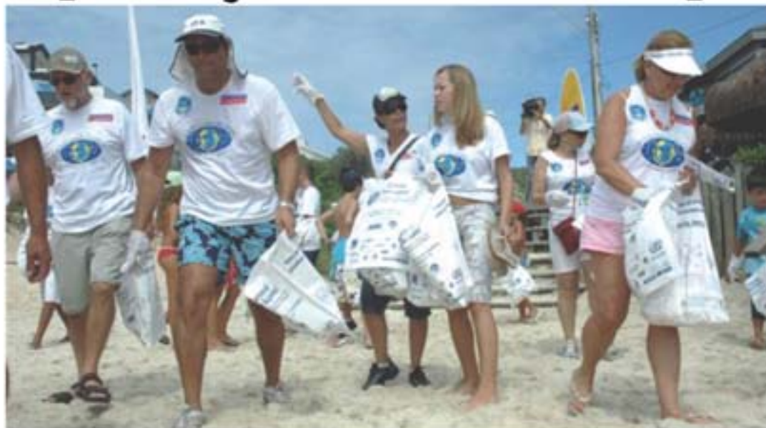
Fiscais da natureza em ação. Mais de 500 kg de lixo na areia