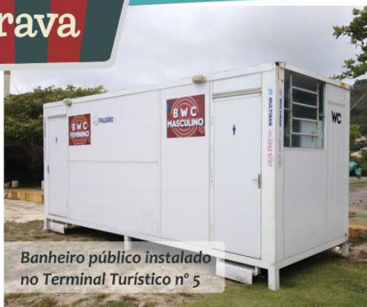
Banheiro público instalado no Terminal Turístico nº 5

Nesta temporada, a Operação Verão da Polícia Militar decidiu reativar as instalações do nosso Posto Policial, funcionando diariamente das 14:00 às 02:00 horas. A APBRAVA forneceu as condições operacionais do Posto, aí incluído faxina, materiais de limpeza e alimentação.